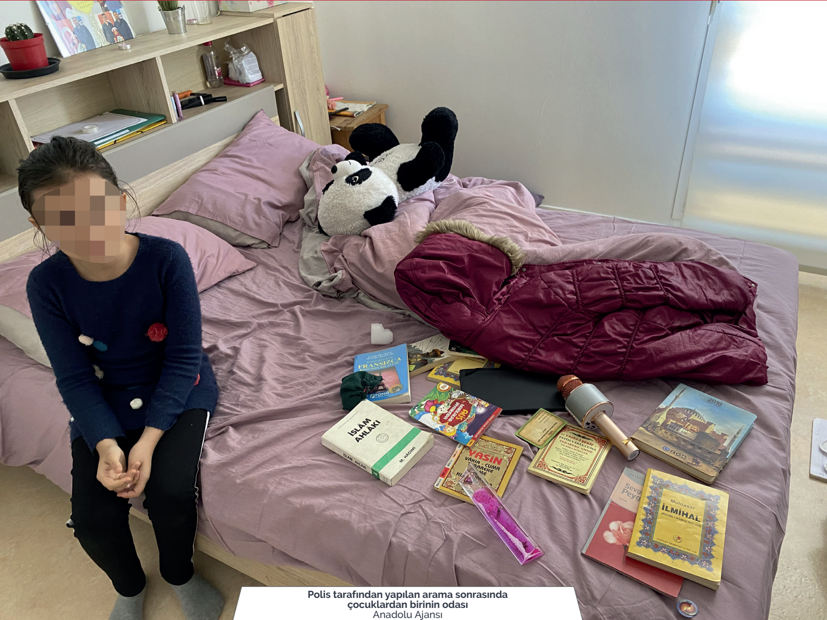
Polis tarafından yapılan arama sonrasında çocuklardan birinin odası

YaŐanan bu vaka karŐısında "insan hakları" ve "çocuk hakları" adına endiŐelerini paylaŐan farklı dinlere de mensup pek çok kesim bulunmakla birlikte, herhangi bir kaçma veya delil karartma Őüphesi olmayan 10 yaŐındaki 4 çocuĐun sabahın erken saatlerinde polis baskını ile alınıp 11 saat alıkonulmasını sorun etmeyerek çocukların Müslüman olması üzerinden nefret söylemine devam eden kitlenin büyüklüĐü, toplumsal ayrıŐmanın ne denli derinleŐtiĐini ortaya koymaktadır.